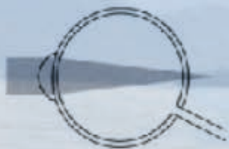
œil presbyte ou hypermétrope